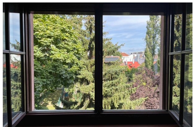
Blick vom Schlafzimmer